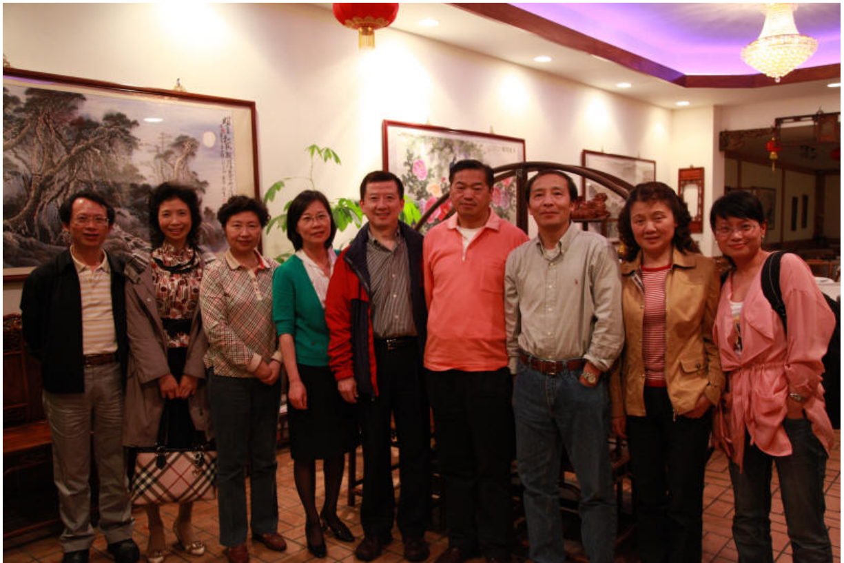
With the alumni in New Jersey Area