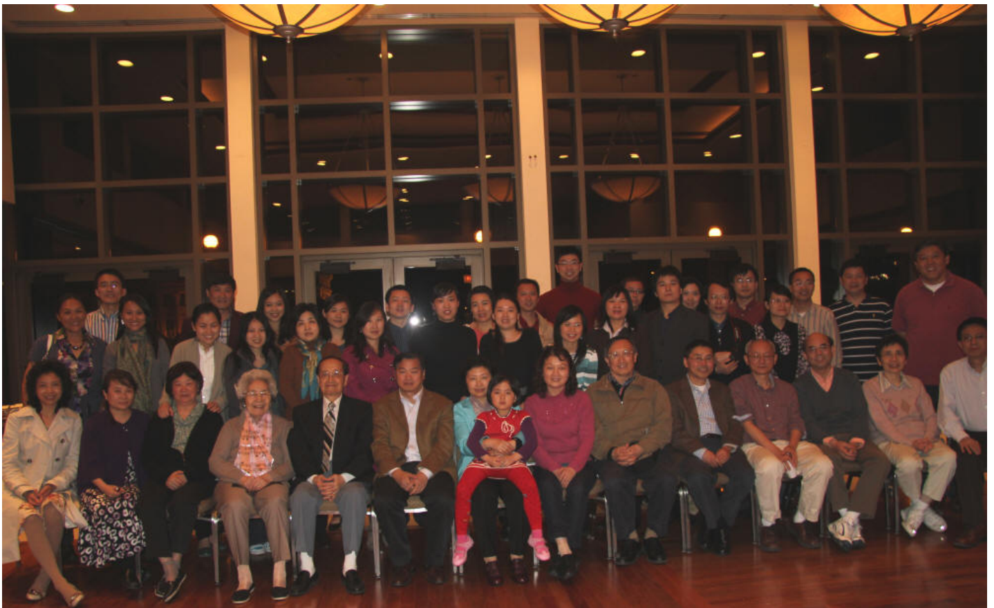
With the alumni in the Greater Chicago area