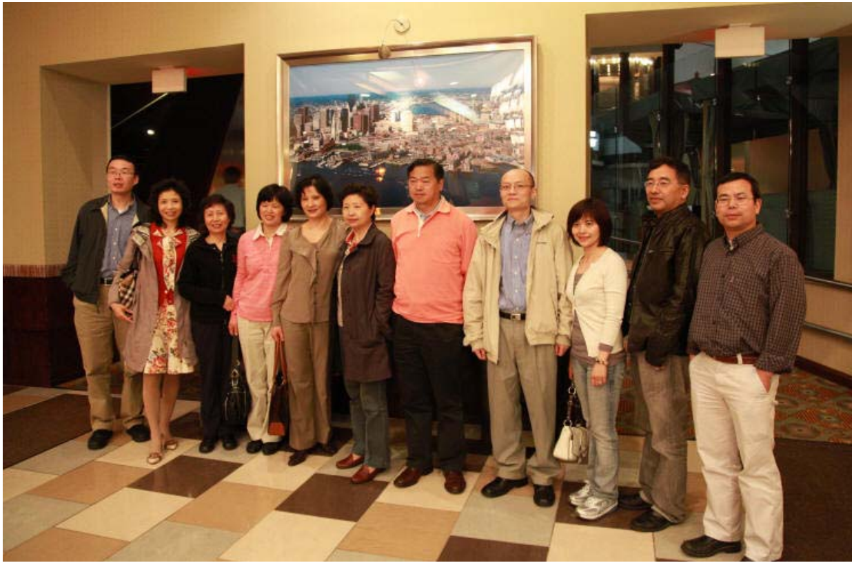
With the alumni in Boston area