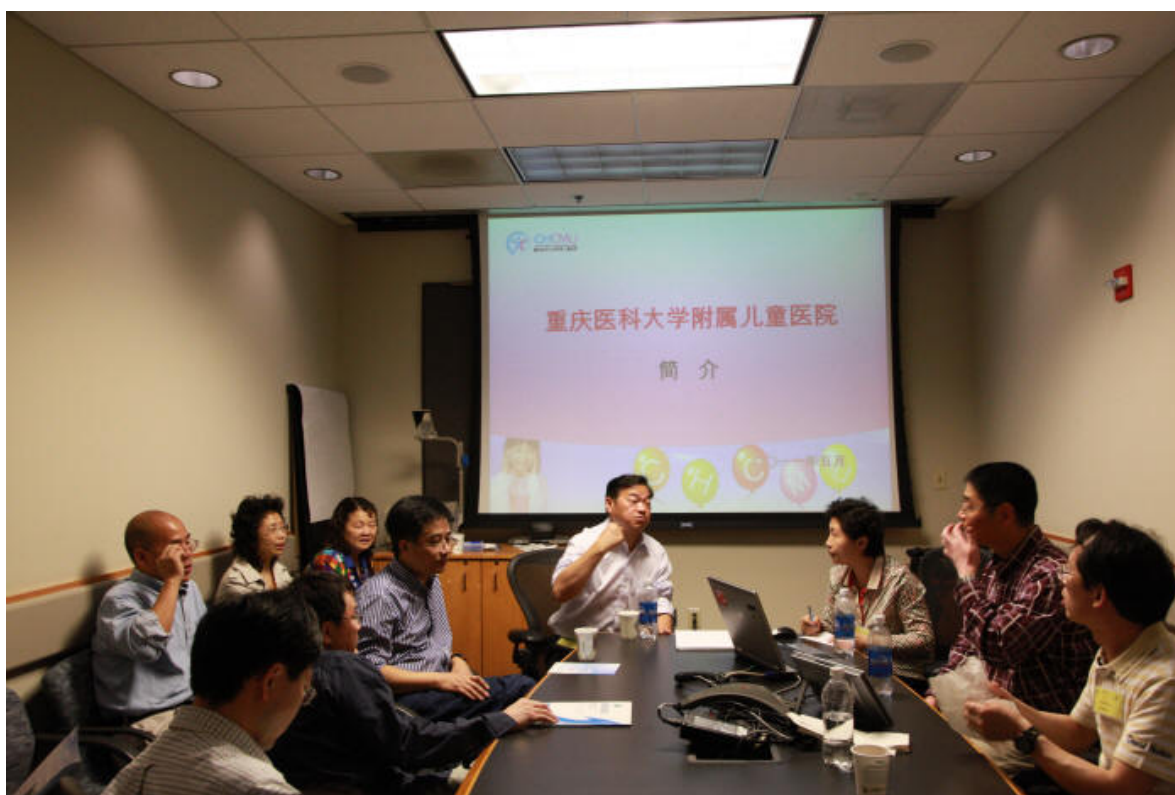
In discussion with alumni in D.C. area/NIH