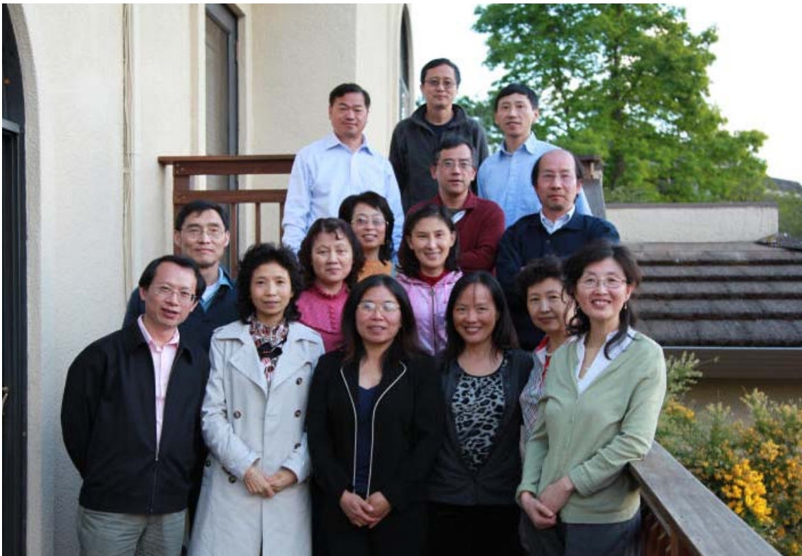
With the alumni in San Francisco area