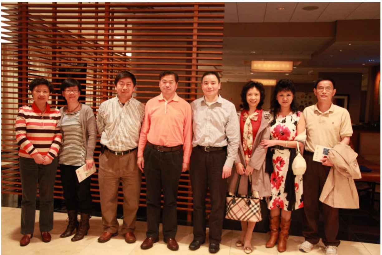
With the alumni in New York City